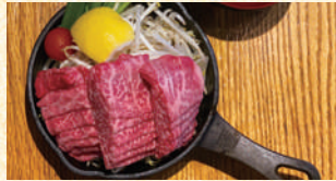
■①赤牛定食②赤牛ステーキ③赤牛ハンバーグ ①1,890円~②2,558円~③1,998円

あか牛のステーキ・ハンバーグ・薄切り肉を店主オリジナルタレで、全て、鉄板で熱々料理を提供します。