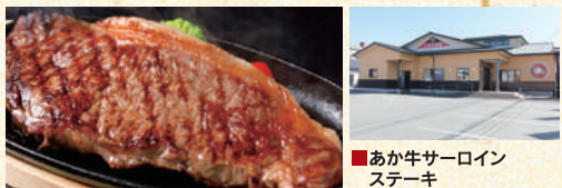
■あか牛サーロイン ステーキ

ビールの酵母を加えた特別な飼料で育てた自社牧場のあか牛「甲誠牛」は、やわらかな肉質が特徴。定番のあか牛丼をはじめサーロインステーキセットやあか牛カルビ丼などメニューも豊富。