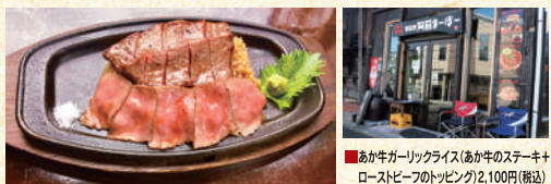
■あか牛ガーリックライス(あか牛のステーキ+ ローストビーフのトッピング)2,100円(税込)

阿蘇を訪れるライダーたちに絶大な人気を誇る「あか牛ガーリックライス」。パンチの効いたガーリックライスを覆うあか牛のステーキとローストビーフのコンボに食欲が止まらない。