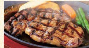
■あか牛ステーキ 4,500円(税込)

創業40年、こだわりの手作りハム・ソーセージで愛される「ひばり工房」敷地内のオープンテラスステーキレストラン。阿蘇の田園風景を眺めながら味わうあか牛のステーキはまさに贅沢な一品。