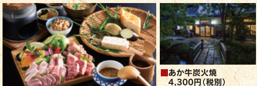
■あか牛炭火焼 4,300円(税別)

囲炉裏で楽しむ炭火焼きや田楽など、阿蘇のあか牛や地元食材、郷土料理などを堪能できる。全席囲炉裏、テーブルが囲炉裏で温めます。