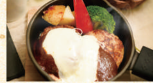
■贅沢食べ比べあか牛とよまとんポークの Wハンバーグセット2,800円(税込)

阿蘇のあか牛と阿蘇の白豚ふたつの味と食感を楽しむ「贅沢食べ比べWハンバーグセット」は話題の一品。感謝を込めて「ウエルカムMILK」でお迎えします。