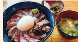
■あか牛丼(並)1,720円(税込) あか牛丼(大盛)2,600円(税込)

あか牛肉を絶妙の焼き加減でグリルしたお肉を新しくなっただし醤油ダレでさっぱりといただけます。いわさきオリジナル肉もそと温泉卵のトッピングも味わえます。