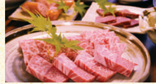
■赤牛焼肉セット 季節の前菜が付きま! 3,750円(税込)~

あか牛の繁殖から肥育まで手掛け、お米も野菜も漬物まですべて自家製にこだわったあか牛焼肉レストラン。阿蘇の大自然が育んだ贅沢な食材を心ゆくまでお楽しみいただけます。