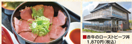
■赤牛のローストビーフ丼 1,870円(税込)

阿蘇を一望できるやまなみハイウェイ沿いの絶景レストラン。あか牛のモモ肉をローストし、肉のうま味を最大限引きだしています。まずは何もつけずにそのまま、めしあがってください。自家製あか牛のミンチの肉みそも濃厚です。まずは御賞味あれ!!