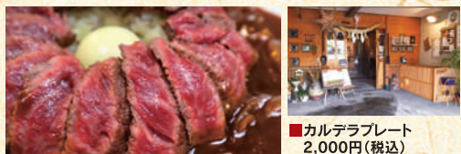
■カルデラプレート 2,000円(税込)

名物あか牛料理とリーズナブルな定食を楽しめる。カルデラをイメージしたご飯にたっぷりとのせたあか牛へ阿蘇のトマトを使ったハヤシソースをかけていただく「カルデラプレート」がおすすめ。