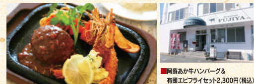
■阿蘇あか牛ハンバーグ& 有卵エビフライセット2,300円(税込)

創業70年の老舗洋食レストラン。くまもとあか牛「阿蘇王」にこだわり、その味の魅力を余すことなく引き出すメニューに地元ファンも多数。あか牛ハンバーグはデミグラスソースとの相性が抜群。