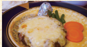
■あか牛チーズハンバーグ 1,200円(税込)

映画「黄泉がえり」のロケ地にも使用された喫茶店。クレープ生地隠れたデミグラスソースとあか牛チーズハンバーグの共演は期待を裏切らない味。ノスタルジックな気分もまた阿蘇に似合う。