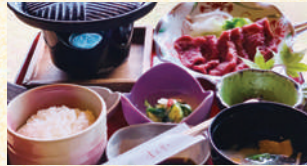
■赤牛ランチ 1,700円(税込)

数寄屋造りの佇まいと四季折々の顔を見せる広々とした庭園が阿蘇で過ごす時間を優雅なものに。鉄板で焼きながら食べる「あか牛ランチ」をはじめ和洋様々な形で郷土料理を満喫できる。