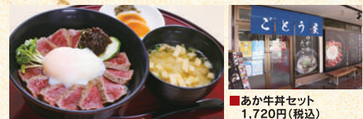
■あか牛丼セット 1,720円(税込)

江戸時代から続く味噌醤油蔵「山内本店」の「まほろしの味噌」を使った「あか牛肉みそ」ときりりと澄んだコク深い「だし醤油ダレ」があか牛丼のひと味違う美味しさの秘密。