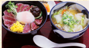
■阿蘇高菜あか牛丼とあか牛 だご汁セット2,100円(税込)

阿蘇カドリードミニオン前のあか牛丼専門店。江戸時代から続く味噌醤油蔵「山内本店」の味噌と醤油ダレがあか牛の美味しさを際立たせてます。あか牛のだしが効いた「だご汁」も是非。