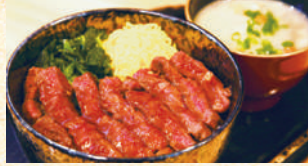
■あか牛ステーキ丼 1,850円(税込)

阿蘇の老舗漬物屋「山一食品」が手掛けるお食事処。高菜漬けなどの阿蘇の伝統的な漬物がバイキングで食べられる。特製ニンニク醤油ダレが効いたあか牛丼や郷土料理を心ゆくまで。