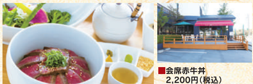
■会席赤牛丼 2,200円(税込)

あか牛の小春煮に和だしをかけお茶漬けにして食べる「会席赤牛丼」が話題。会席料理を得意とする料理長が試行錯誤を重ねひつまぶしをヒントに生まれた新しい名物に絶賛の声がやまない。