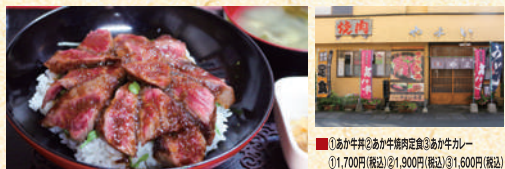
■①あか牛丼②あか牛焼肉定食③あか牛カレー ①1,700円(税込)②1,900円(税込)③1,600円(税込)

創業70年余り。阿蘇神社に最も近いあか牛丼のお店がここ。阿蘇産のお米の上にシャキシャキとしたレタスを載せレアに焼きあがったあか牛のお肉を自家製ダレと絡めるこだわりの一杯。