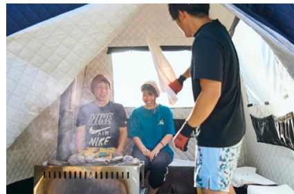
テントサウナ体験の様子